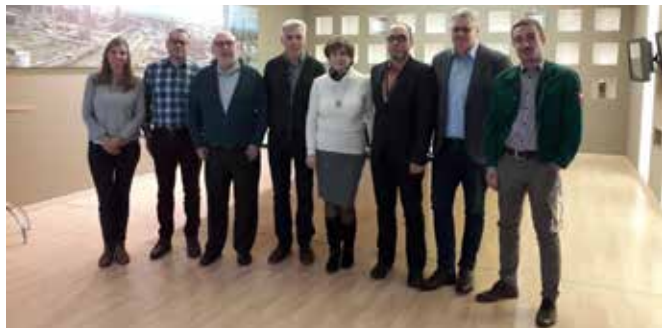
De ACVBIE-delegatie samen met de vakbondsverantwoordelijken met MOL.

de sociale dialoog hoog op de agenda. De Hongaarse vakbonden en hun militanten waren voornamelijk geïnteresseerd in het sectoroverleg zoals we het in België kennen. In Hongarije wordt er enkel op ondernemingsvlak onderhandeld en dat ondermijnt de slagkracht van de vakbonden bij het streven naar een waardige lonen. ACVBIE blijft de acties van MOL voor een volwaardige sociale dialoog in Hongarije solidair ondersteunen.