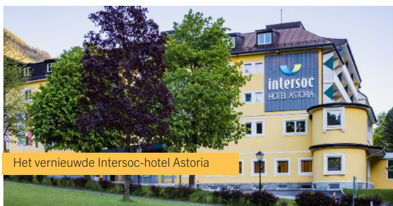
Het vernieuwde Intersoc-hotel Astoria