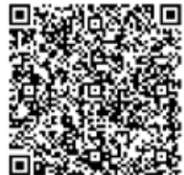
Scan en zet COC in je contacten