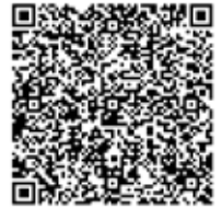
Scan en zet COV in je contacten

Word fan op onze Facebookpagina: facebook.com/COConderwijs/ en volg ons op Twitter (@COConderwijs) en Instagram (@coc.onderwijs)!