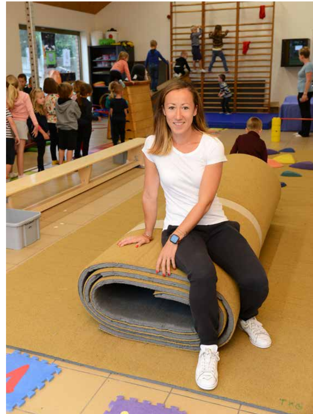
Ik wil inspireren om kleuters ook thuis te laten bewegen.