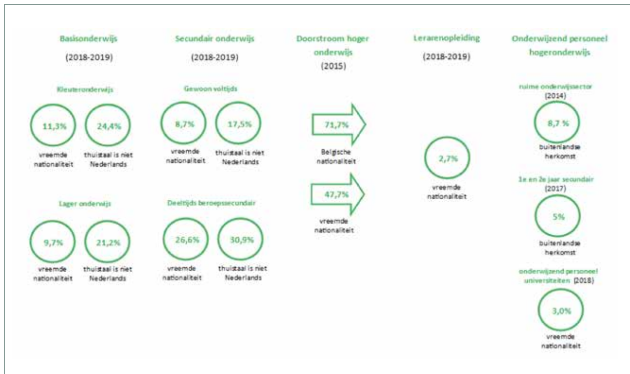
Figuur 3. Percentages personen van buitenlandse herkomst doorheen het Vlaamse onderwijs