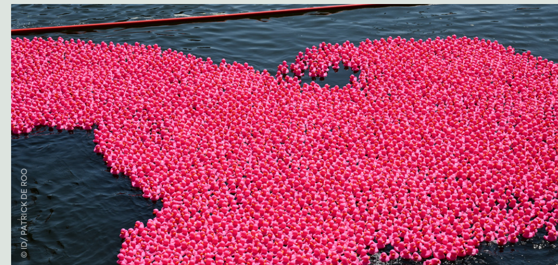
De 'Pink Duck Race' in Antwerpen, afgelopen zomer, wilde bijdragen aan bewustwording over borstkanker.

Borstkankerpatiënten in België hebben alsmaar meer kans om hun ziekte te overleven, blijkt uit cijfers van zowel het Vlaams Instituut voor Kwaliteit en Zorg, als van Stichting Kankerregister. Dat is het gevolg van wetenschappelijke vooruitgang, vroegtijdige opsporing en erkende expertisecentra.