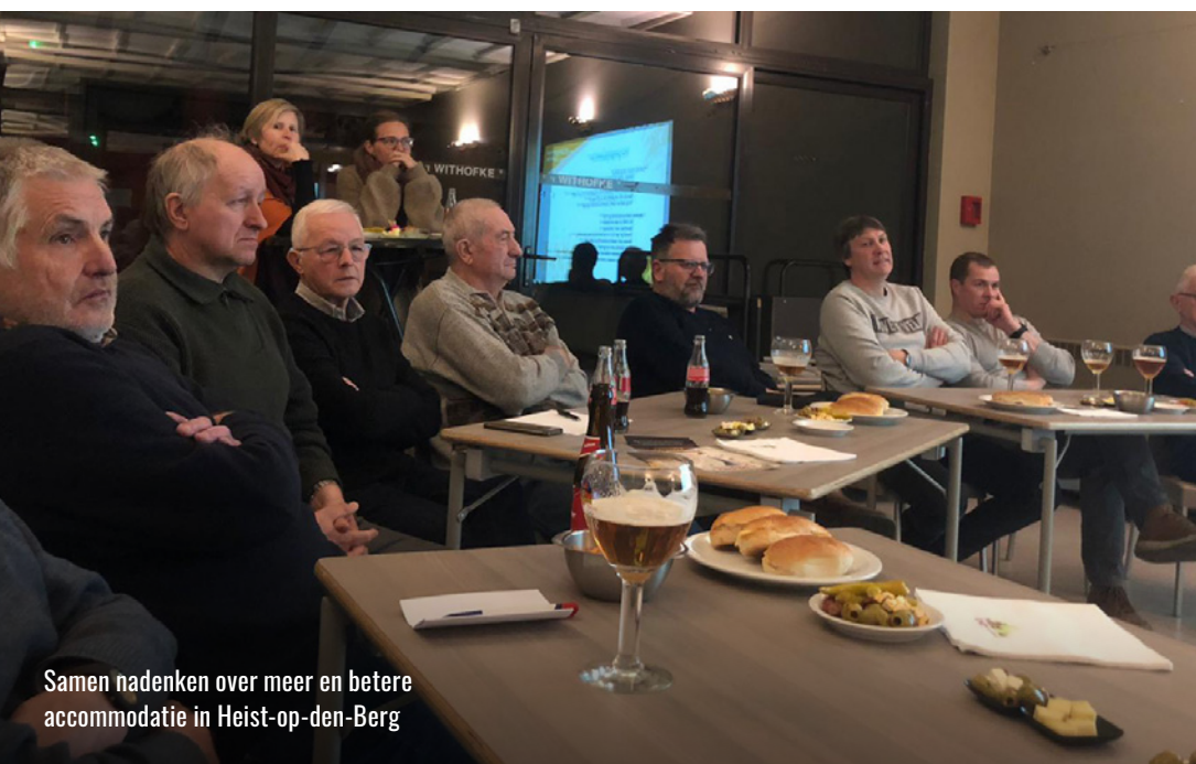
Samen nadenken over meer en betere accommodatie in Heist-op-den-Berg

Vanuit het noodfonds werd een eerste ervaring opgedaan in het sectorover- schrijdend ondersteunen van vereni- gen en kwam de behoefte aan een meer algemeen ondersteuningsbeleid naar bo- ven. Het Heistse gemeentebestuur heeft hier nu op ingespeeld door een reglement uit te vaardigen dat de erkenningsvoor- waarden voor al deze verenigingen op een transparante manier vastlegt en een