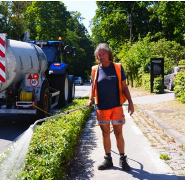
UV-straling door de zon vormt het grootste kankerrisico op het werk.

→ Tekst Nils De Neubourg