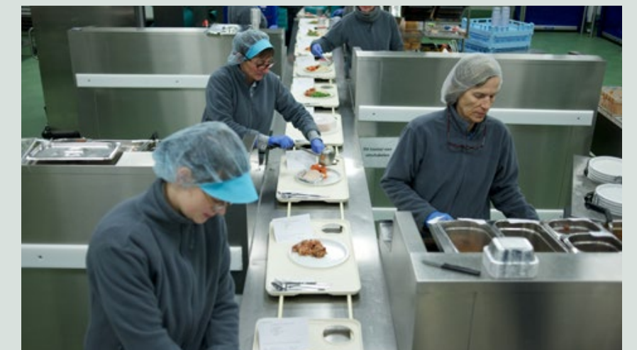
Veel handwerkers kampen met spier- en skeletaandoeningen waardoor ze langdurig ziek worden.

'Daarmee blijft een van de voornaamste conclusies van het Rekenhof overeind: het aantal succesvolle re-integratietrajecten is onvoldoende in het licht van het huidige aantal langdurige zieken. De cijfers maken duidelijk dat zolang ziekmakend werk niet wordt aangepakt, het individueel re-integratiebeleid een weinig effectieve maatregel vormt. Eerst moeten de aan werk gerelateerde oorzaken aangepakt worden, zoals werkdruk en risicofactoren waaronder het tillen van zware lasten en repetitieve handelingen', besluit Hermans. ■