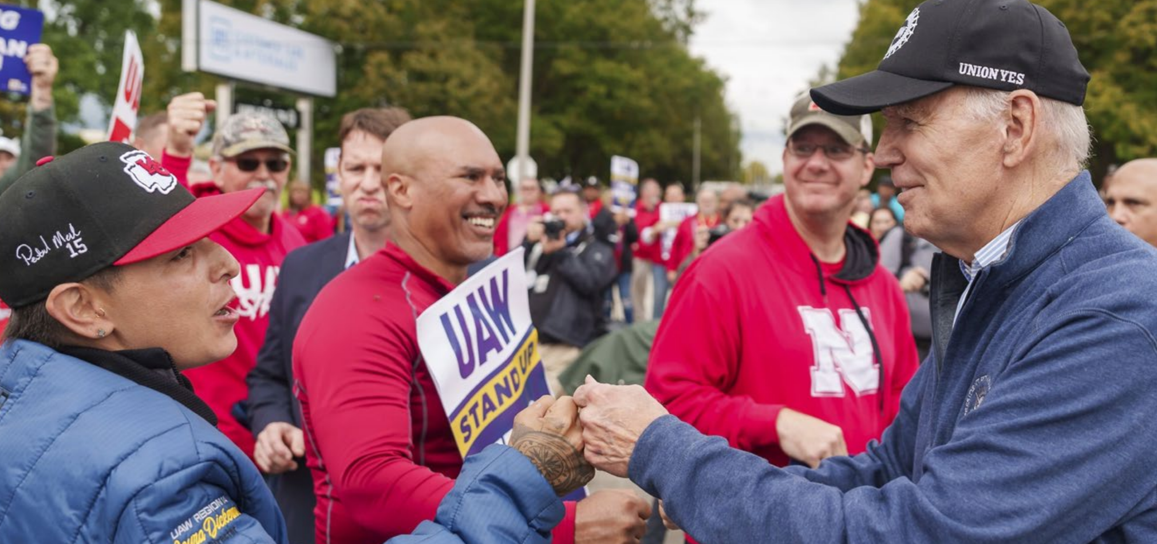
VS-president Joe Biden bezoekt een stakerspiket. De uitzondering die de regel bevestigt.