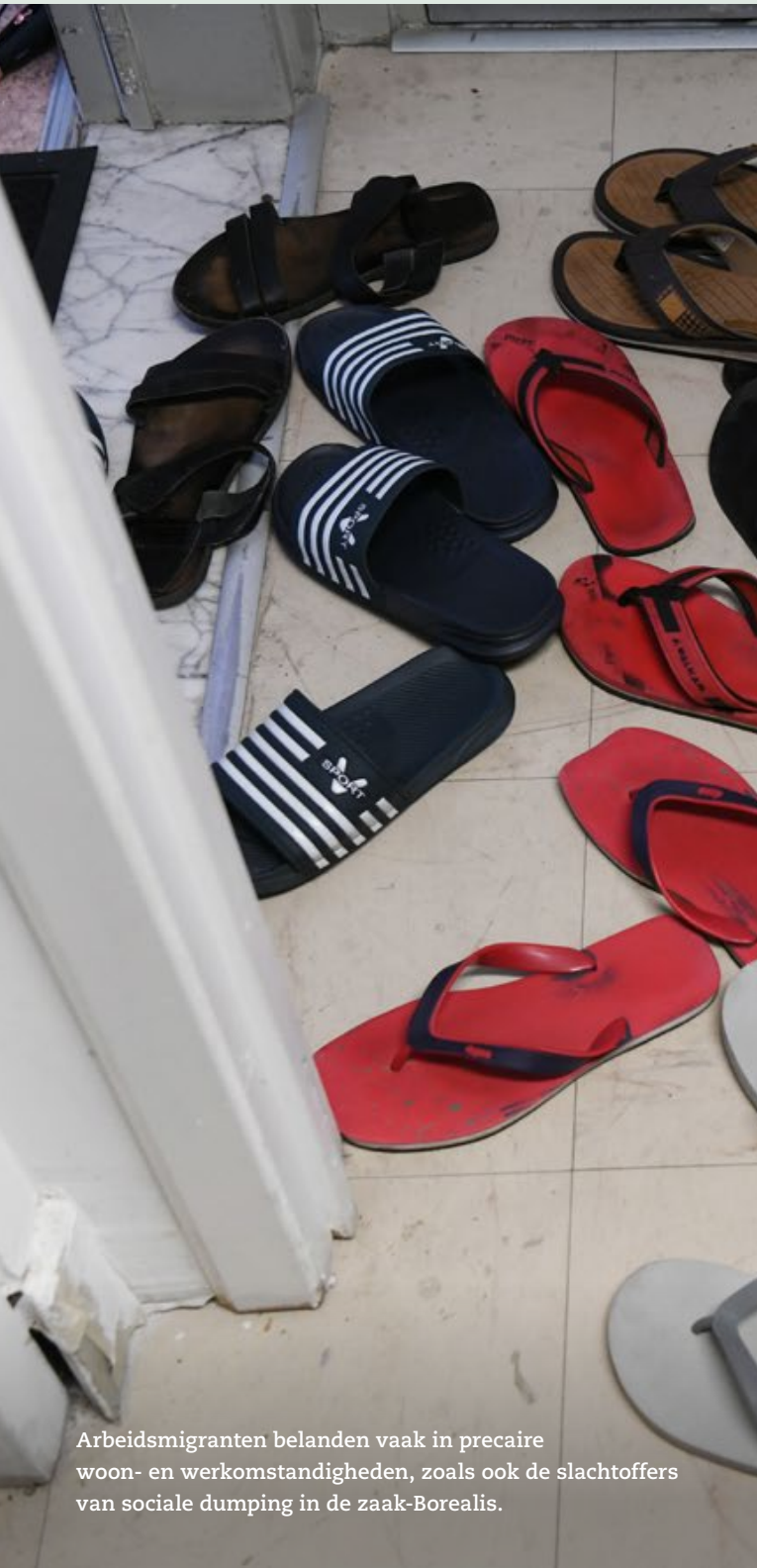
Arbeidsmigranten belanden vaak in preciaire woon- en werkomstandigheden, zoals ook de slachtoffers van sociale dumping in de zaak-Borealis.

Op een jaar tijd verdubbelde het aantal arbeidsmigranten van buiten de Europese Unie. Maar recente schandalen bij onder meer chemiereus Borealis tonen aan dat er nood is aan een betere regulering en meer controle. Op 7 juli komen de bevoegde ministers samen.