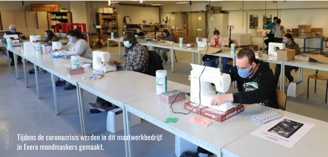
Tijdens de coronacrisis werden in dit maatwerkbedrijf in Evere mondklappers gemaakt.

Een knelpunt is volgens Herpoele dat bij individueel maatwerk voortaan uitzendwerk mogelijk is. ‘Het gaat om kwetsbare werknemers. Nog meer dan anderen hebben zij nood aan duurzame werkgelegenheid. Hopelijk zijn het niet die kwetsbare mensen die als eerste zullen worden ontslagen, wanneer het bedrijf een moeilijkere periode kent.’ ■