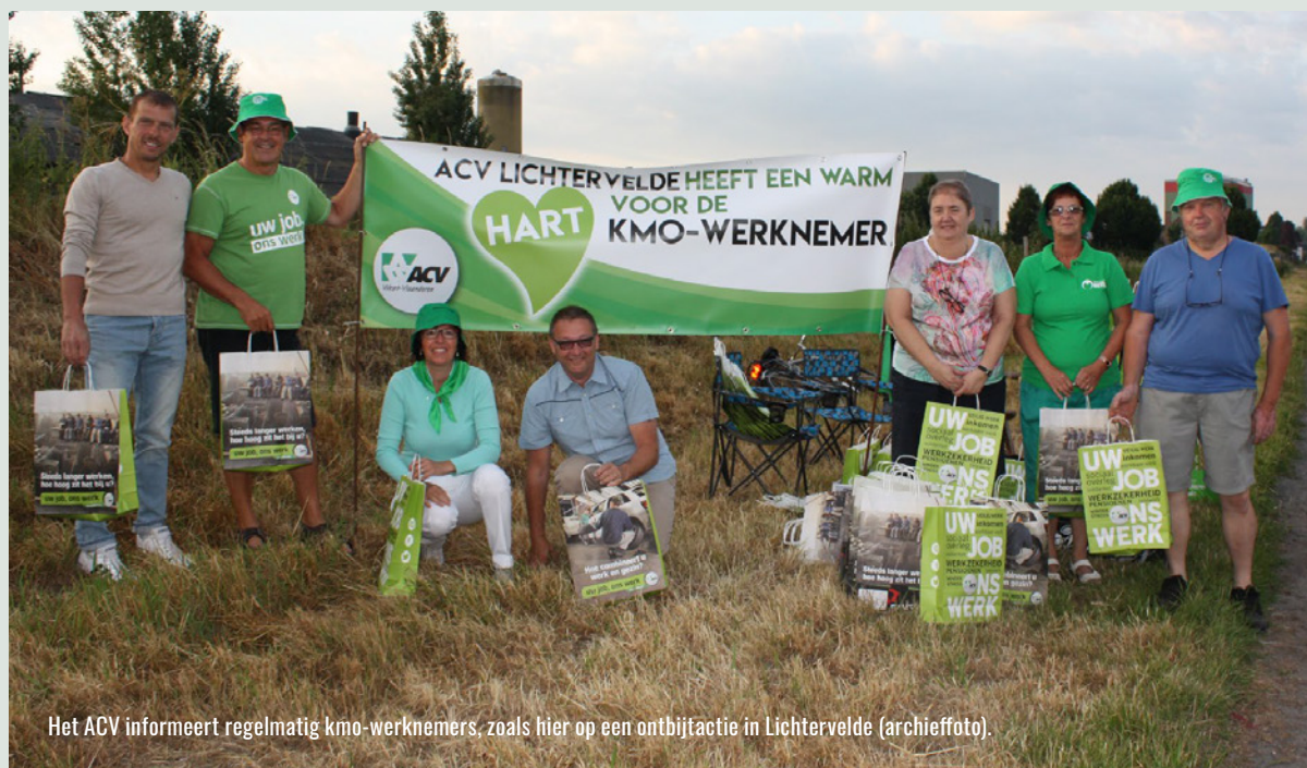
Het ACV informeert regelmatig kmo-werknemers, zoals hier op een ontbijtactie in Lichtervelde (archieffoto).