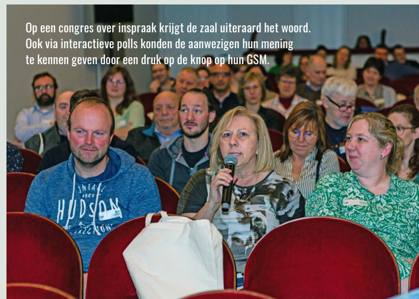
Op een congres over inspraak krijgt de zaal uiteraard het woord. Ook via interactieve polls konden de aanwezigen hun mening te kennen geven door een druk op de knop op hun GSM.