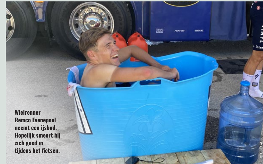
Wielrenner Remco Evenepoel neemt een ijsbad. Hopelijk smeert hij zich goed in tijdens het fietsen.