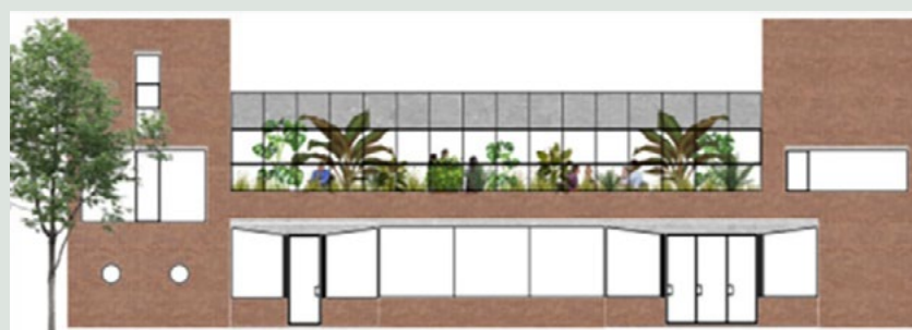
Zo zal de voorgevel van de 'nieuwe Bond' er uitzien.