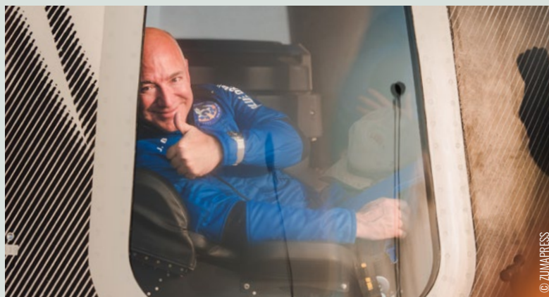
Amazonoprichter Jeff Bezos, een van de rijkste mensen ter wereld, in zijn ruimteschip. Hij wist het zo te regelen dat hij in 2011 geen cent moest betalen aan de Amerikaanse belastingdienst.