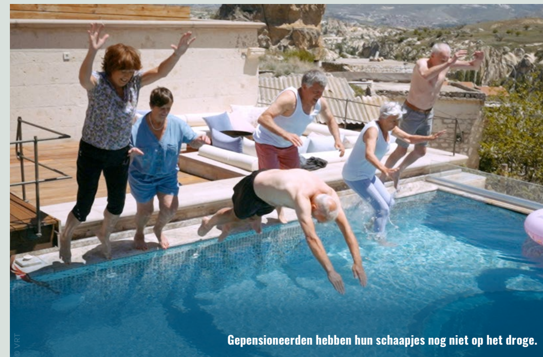
Gepensioneerden hebben hun schaaapjes nog niet op het droge.

Al jaren klinkt de roep om een verhoging van het minimumpensioen naar 1 500 euro netto. Bij de pensioenhervorming van afgelopen zomer beloofde minister Karine Lalieux (PS) zelfs om dat minimum op te trekken tot 1 640 euro netto. Maar lang niet iedereen krijgt het minimum, ondanks de misleidende naam.