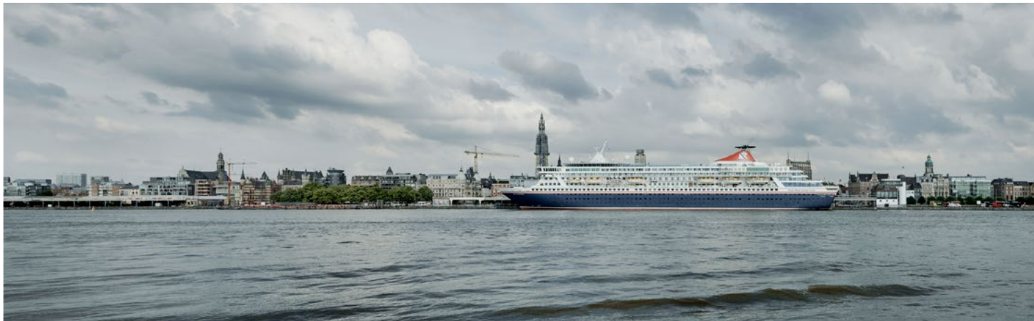
Internationale politiediensten ontdekten in het buitenland al vaker misbruik en mensenhandel in de binnenscheepvaart, vooral in de wasserijen en keukens van de riviercruises.

‘De arbeidswetgeving aan boord van een schip is ingewikkeld en helemaal anders dan die voor een doorsnee Belgische werknemer. Dat is logisch, want zo’n schip vaart makkelijk twee tot drie keer per week een landsgrens over. Onder welke arbeidsregels en sociale zekerheid val je dan? Daarom is er afgesproken om aan boord één systeem te hanteren. Alleen is dat heel specifiek en ingewikkeld. Op een passagierschip gelden bijvoorbeeld andere regels dan op een tanker. Dat maakt dat niet alle uitzendkantoren over de nodige kennis beschikken.’ ■