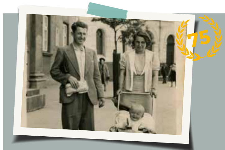
In 1930 komt er een wet op de kinderbijslag. Maar een werkloosheids- en ziekteverzekering zijn nog steeds niet verplicht.

Dezelfde redenering geldt voor zieke en invalide werknemers. Het project 'return to work' had de werknemers een interessant perspectief kunnen bieden wanneer ze het werk willen hervatten na een periode van ongeschiktheid. De regering-Michel wilde er echter een sanc-