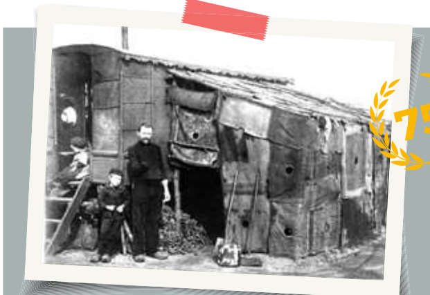
Het industriële België kent in de 19de eeuw geen sociaal vangnet. Wie zijn werk verliest of niet meer kan werken, verzeilt in armoede. Liefdadigheid biedt dan de enige redding.