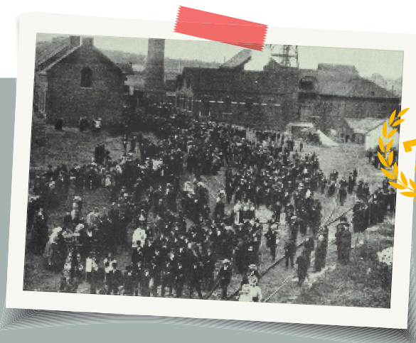
In de jaren 1920 groeit de aandacht voor sociale wetgeving. In 1924 wordt een verplichte pensioenverzekering voor alle arbeiders ingesteld, gefinancierd met bijdragen van arbeiders en werkgevers. Een jaar later wordt dit uitgebreid tot de bedienden.